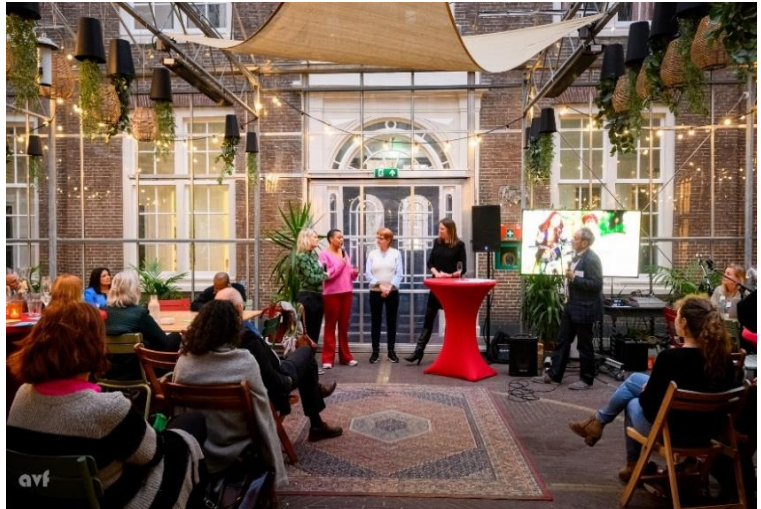
In een vol atrium van het Huis van de Diaconie onderzochten de panelleden onder leiding van de voorzitter de positie van Leergeld tussen leef- en systeemwereld.

Daarin konden de panelleden én de zaal zich vinden.